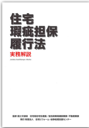
講習会で使われたテキスト

平成21年10月1日の法律の本格施行に向け、同日以降の新築住宅の引渡しに際し、瑕疵担保責任の履行のための資力確保措置（供託又は保険加入）が義務づけられることから、法制度の内容や資力確保措置の手続き等の実務について、住宅事業者にあまねく周知を図る。という趣旨で、建設業、不動産・宅建業等を対象に全国各地で講習会が平成20年度内に開催されました。